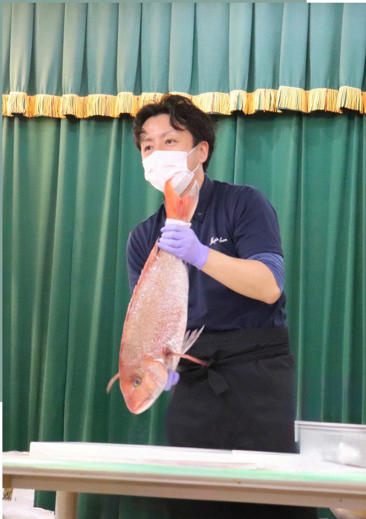
ひな祭り 特別企画 施設長による解体ショー