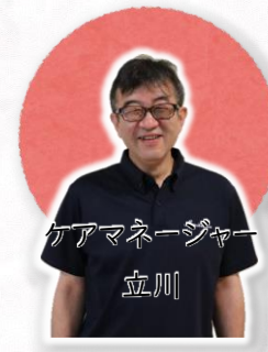
ケアマネージャー 立川